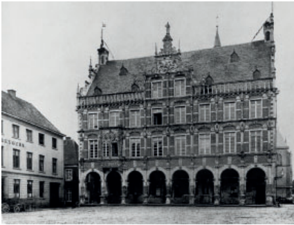
Bild: Rathaus mit Marktplatz, links der Gasthof Reygers

Die nachfolgende, aus fünf Kürzestgeschichten bestehende fiktive Erzählung „Totmacher unter sich“ spielt sich im Wesentlichen hier ab: